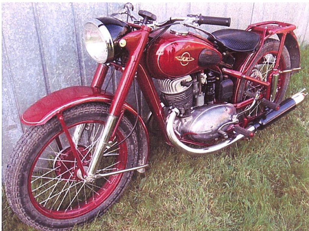
Diagonaalvaade esiosale ja vasakule küljele