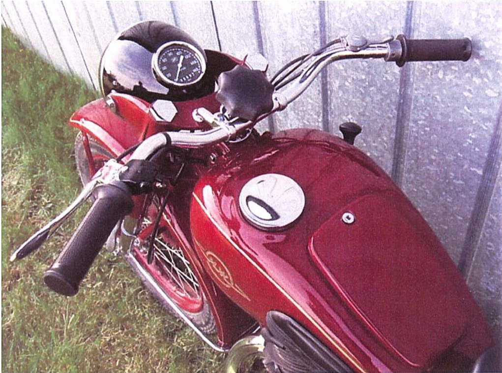
Vaade sõiduki juhtimisseadmetele