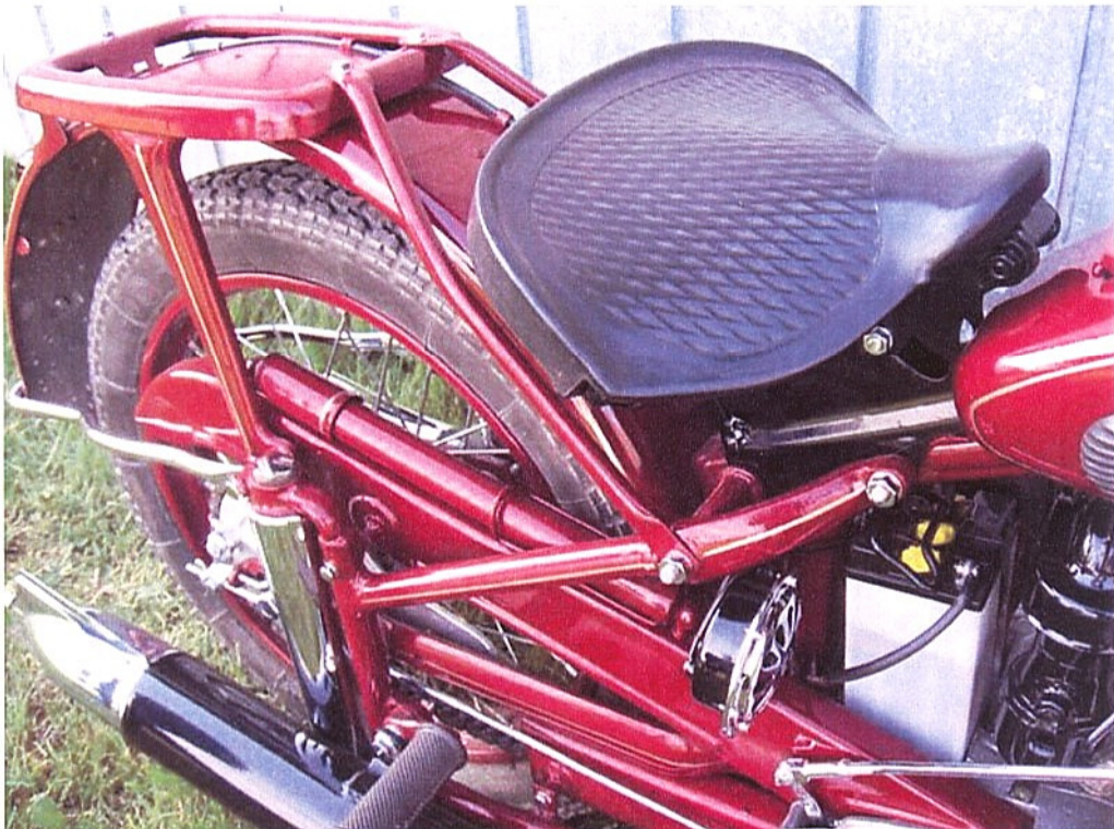
Vaade sõiduki istme(te)le