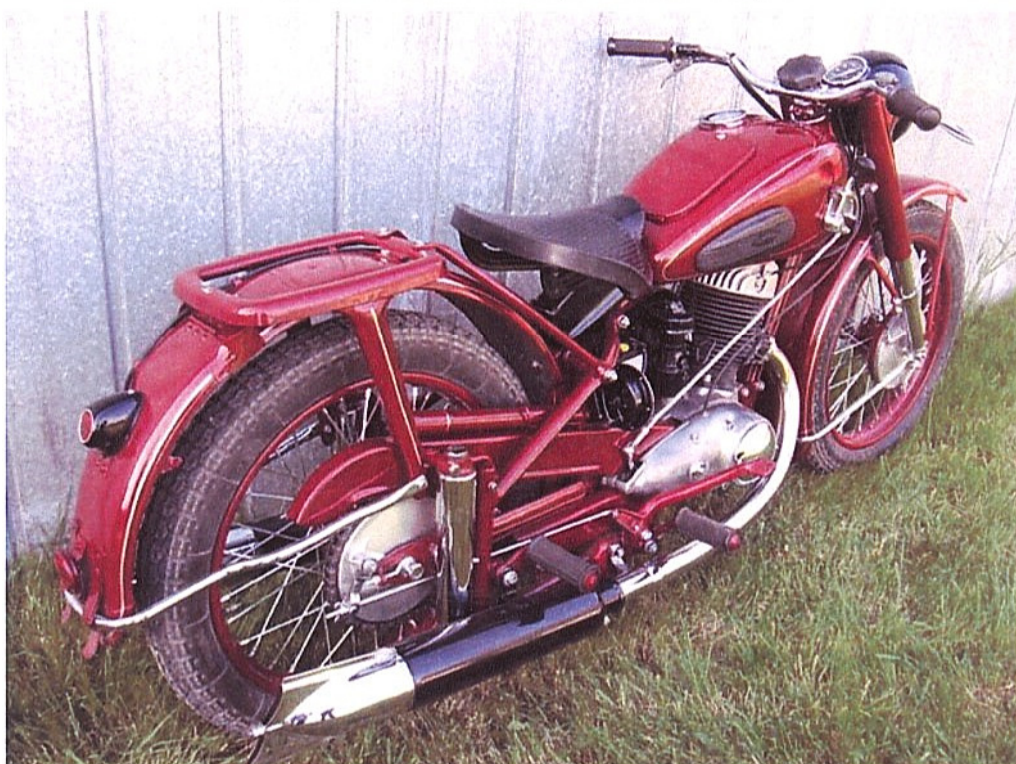
Diagonaalvaade tagaosale ja paremale küljele